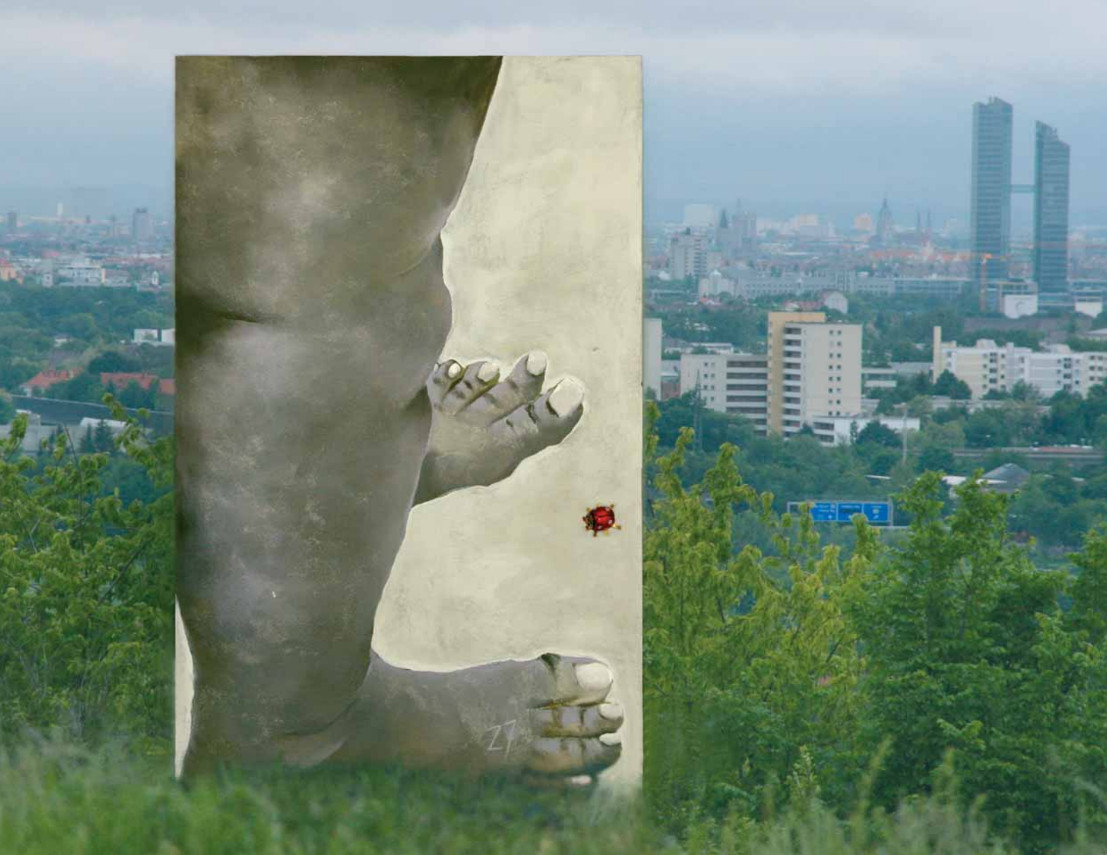
Skylla und Charybdis 2007