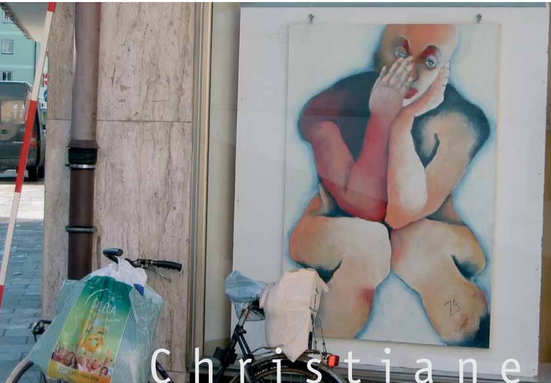
Erda 2004 aus „Es war einmal“