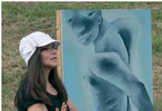
Othello 2003 aus Nymphenberg

Henric L. Wuermeling aus der Eröffnungsrede zu „Nymphenberg“ 2007 auf dem ehemaligen Münchner Müllberg.